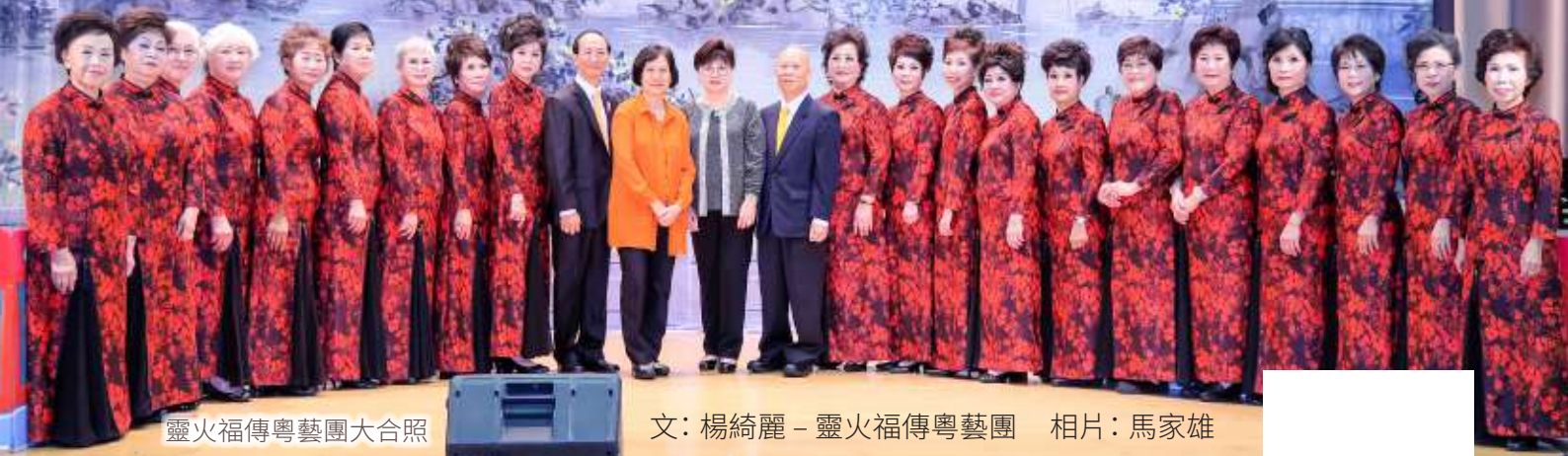
靈火福傳粵藝團大合照