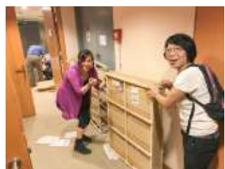
聖像畫講座及展覽籌備小組成員在展覽場地落力運送展品及佈置