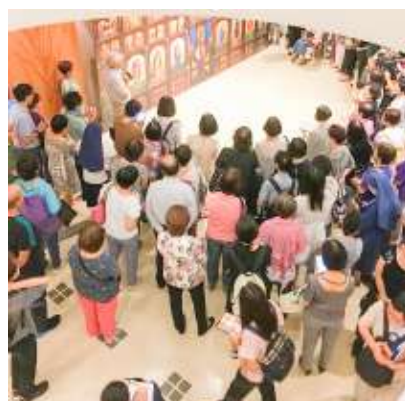
來賓參加聖像畫展覽 開幕祝福禮