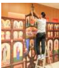
聖像畫展覽開幕禮前聖像屏風運抵展覽場地，籌備小組迅速佈置趕及開幕祝福禮