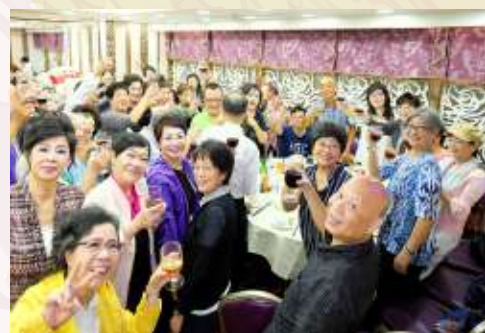
晚上的感恩宴（俗稱慶功宴）