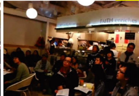
當晚有60人一同參與祈禱