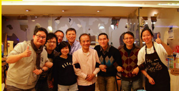
嘉賓、義工一同合照