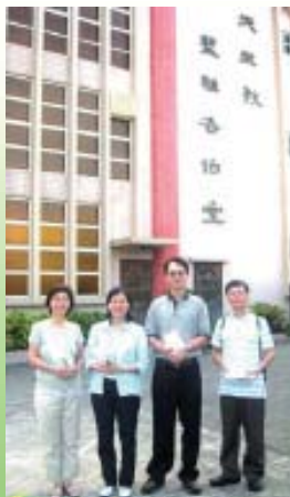
第一分會會員派發《靈閱三十》