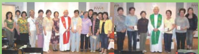
十五位新會員於十月五日及十一月二日在靈火文化中心宣誓加入本會組成了第十二分會